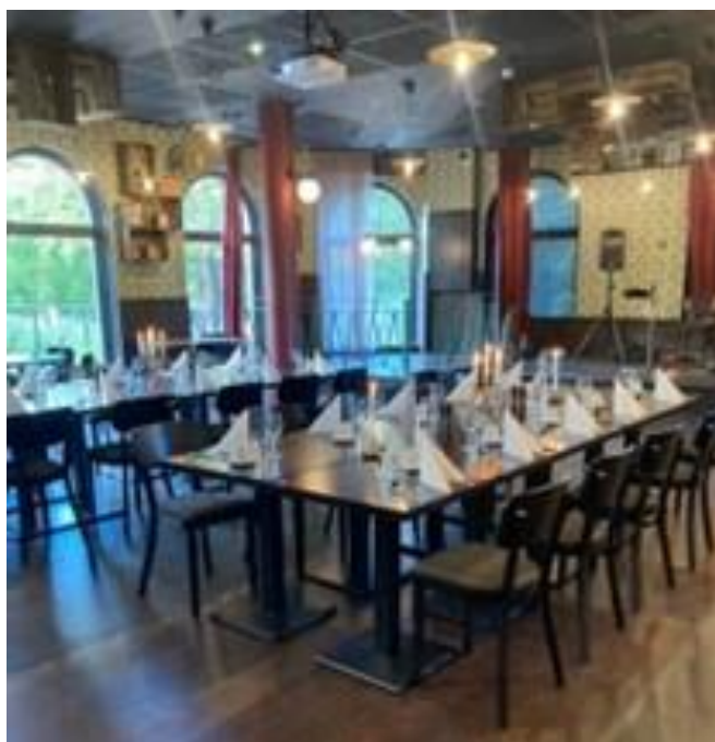
50-årsjubileum i Hudiksvall, september 2022

Arbeta med konsulttjänster och utbildningar via de av NTF-förbund ägda bolagen Säker Trafik; -Vänerland AB, -Jönköping AB och -Dalarna AB riktade mot kommuner, landsting och företag, anpassade efter det lokala behovet, samt utföra nationella projekten åt Trafikverket.