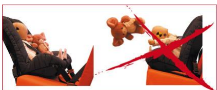
Bakåtvänd respektive framåtvänd bilbarnstol i frontalkrock.

Hur utsatt barnet är kan man se vid till exempel krockprov. I en frontalkollision slungas barnet framåt i den riktning bilen körde. På den högra sidan av bilden nedan slungas det framåtvända barnets kropp framåt och det är bara bältet som håller kvar barnet i stolen. Belastningen på den delen av kroppen som bältet ligger an mot blir därför mycket stor. På grund av det proportionellt sett tunga barnhuvudet som också slungas framåt blir belastningen på barnets nacke särskilt hög. Jämför nu med den vänstra sidan av bilden.