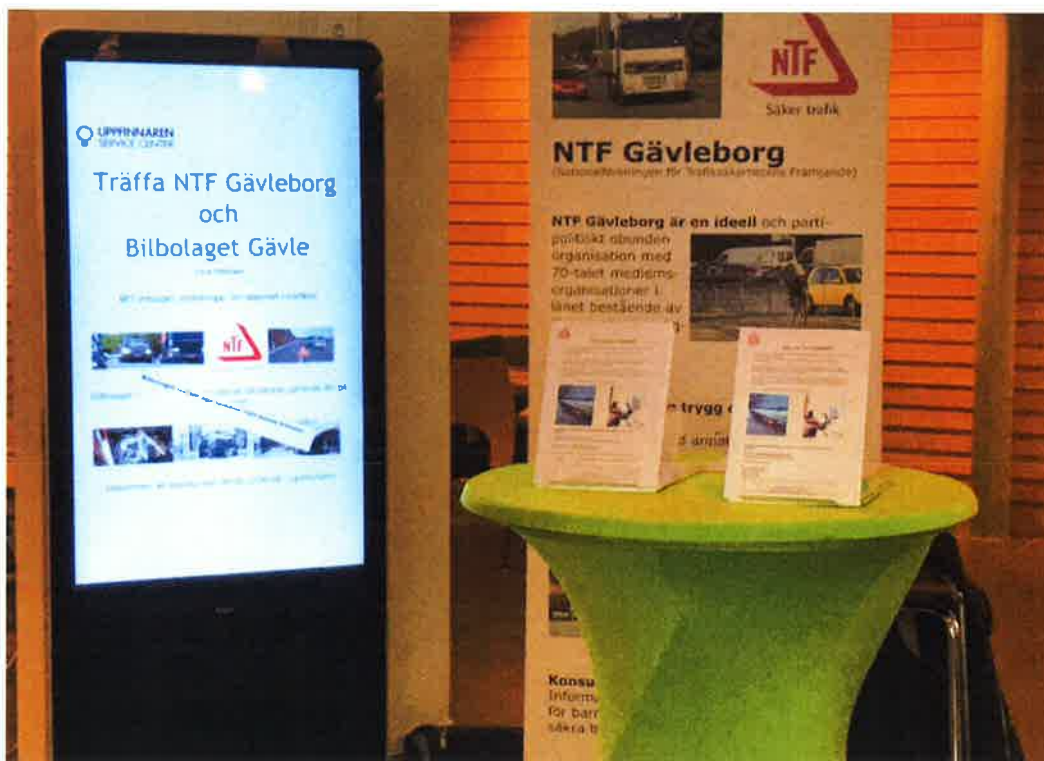
Teknikparken i Gävle, februari 2020