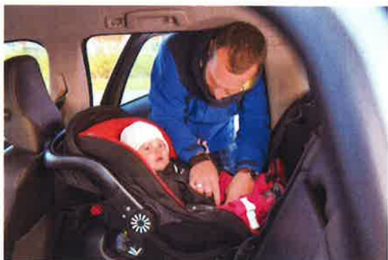
Viktigt att barnen åker bakåtvänt så länge som möjligt.

Av sju inbokade skolor under vårterminen har sex skolor fått ombokas till augusti. Fysiska möten i Hofors kommun: på Solbergaskolan, Petreskolan och Värnaskolan. Digitala möten i Ovanåkers kommun (p.g.a. besöksförbud): Celsiusskolan, Lillboskolan, Knådaskolan och Rotebergs skola. Totalt 49 pedagoger nåddes av informationen. I projektet ingick även deltagande på föräldramöten, p.g.a. coronapandemin fick vi inte delta fysiskt. Informationen skickades ut till alla föräldrar på skolorna i Ovanåker av dess rektorer.