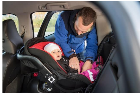
Viktigt att barnen åker bakåtvänt så länge som möjligt.

Tre föreläsningar om trafiksäkerhet för barn i bil har hållits på BVC i Bollnäs för totalt cirka 15 föräldrar samt personal.