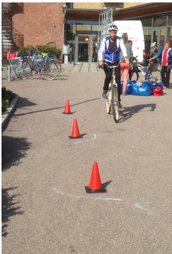
Cykeldag på SFI Sandviken, september 2018