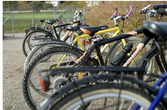
Inriktning i flera projekt har varit att få barn att cykla eller gå till skolan.

En förutsättning för att genomföra projekten med alla delaktiviteter är medverkan från våra medlemsorganisationer samt andra föreningar, organisationer och företag i länet.